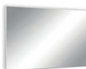
LAVA® GLAS 2.0 Mirror