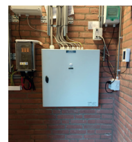
SCHAKELKAST OP MAAT